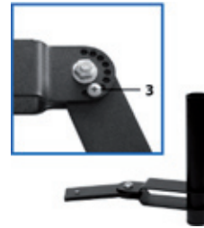
Verbindingsstuk BQE 02 Angle piece BQE 02 Verbindungsstück BQE 02