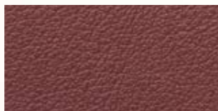
rioja, aubergine, bordeaux 176