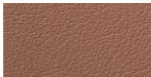
nuss, chestnut, noisette 179