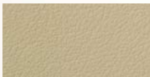
champagner, ginger, champagne 178