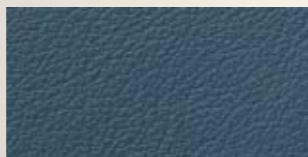
pazifik, pacific, pacifique 173